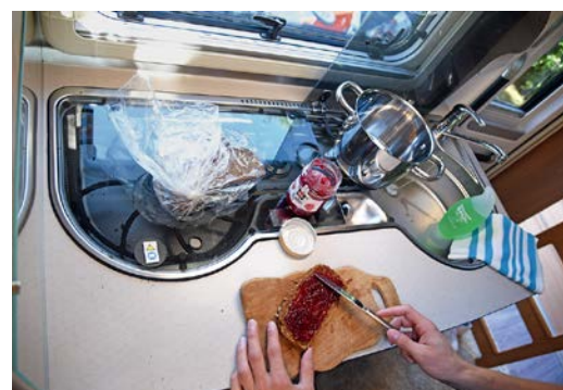
+ Het keukenblok heeft standaard afmetingen en biedt veel opbergruimte en voldoende werkruimte.