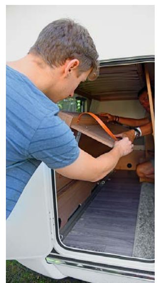
+ In de garage passen kleinere fietsen perfect. Het klapmechanisme van het onderste bed is in orde.