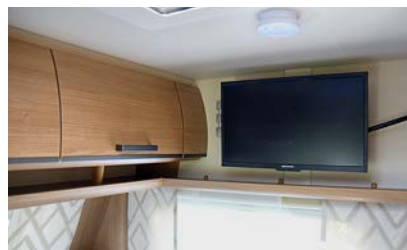
+ De tv vindt een plek aan de zijkant boven het bed. Hier is een aansluiting en een beugel aan de wand. Zo kun je hem draaien en er ook vanuit de dinette naar kijken.