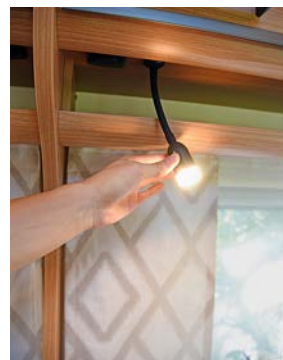
+ Het lichtconcept maakt het mogelijk elk lichtpunt afzonderlijk of juist alles gelijktijdig te bedienen. Er zijn plafondlampen, indirect licht en leeslampjes met usb-stopcontacten.