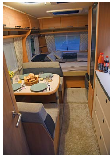
+ De Fendt Saphir beschikt over een mooi, modern en hoogwaardig afgewerkt interieur in hout met ingetogen tinten voor de stoffen. De indeling is eigenlijk bedoeld voor een gezin met kinderen, maar ook vier volwassenen kunnen erin kamperen omdat de stapelbedden breed genoeg zijn.