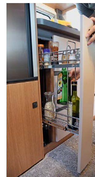
+ De kleine apothekerskast biedt ruimte voor flessen en voorraden.