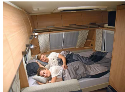
+/- Het tweepersoonsbed voorin is comfortabel, er zijn veel opbergplanken rondom en er is goed licht. De toegang is echter wat smal.