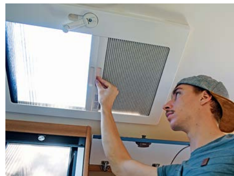
+ Het dakraam heeft een degelijke slinger.