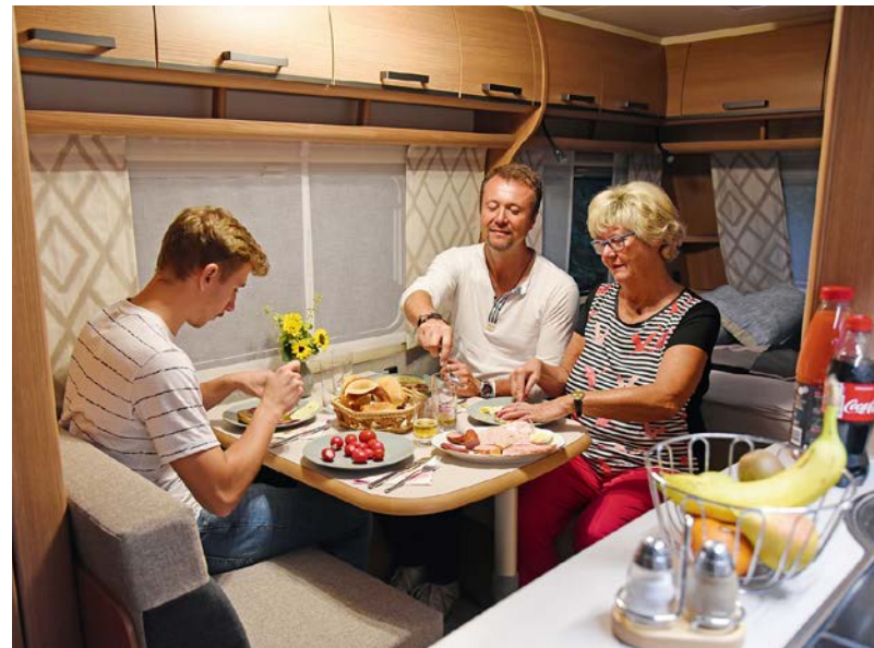
+/- De dinette is voldoende voor vier personen, maar erg groot is de ruimte niet.