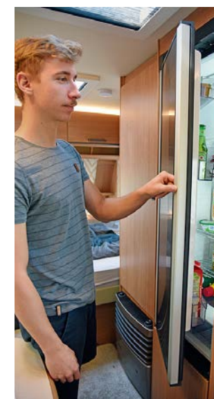
+ De deur van de koelkast kan vanaf beide zijden worden geopend. De ruimte is royaal en goed ingedeeld.