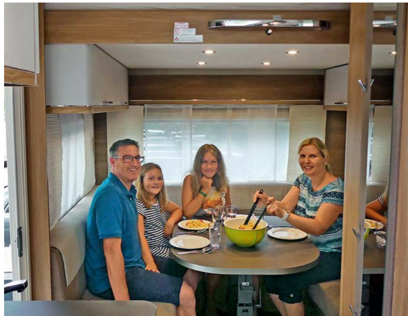
+ De zitgroep heeft comfortabele zittkussens en ondanks het hefbed erboven voldoende hoofdruimte. Er is ruimte voor vijf personen.