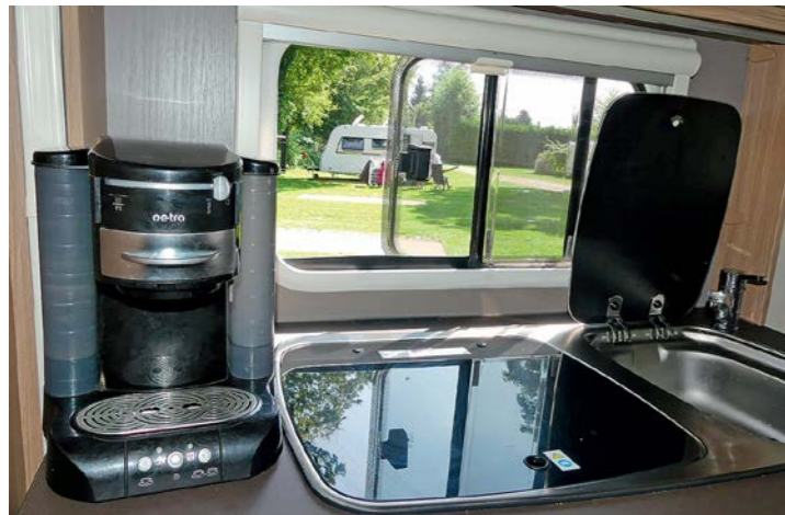
+ De kookplaat laat nog wat ruimte over voor de koffiezetter. Erachter zit een schuifraam.