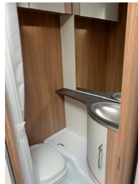
+ De toiletruimte is compact, - douchen is onmogelijk ondanks het douchegordijn.

onze twee meisjes daar het rijk alleen. Er is zelfs een kleine dinette waaraan ze kunnen spelen. Zo kunnen ze hun speelgoed zonder gemopper van hun ouders op tafel laten liggen. Achter de zitbank en bovenin is er genoeg ruimte om spelletjes en dergelijke op te bergen. Tijdens de reis kan je spelletjes en dergelijke in de bergruimte onder de zitbank kwijt. De stapelbedden zijn 74 respectievelijk 76 centimeter breed en daarmee redelijk comfortabel. Elke kind heeft een eigen raam en een lees-/nachtlampje met usb-stopcontact. Het kindergeedeelte is door een vouwgordijn makkelijk van de rest van de caravan af te screenen.