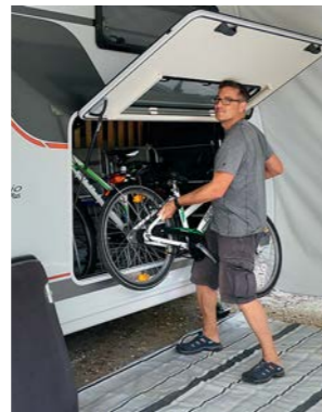
+ Het beladen van de bagageruimte onder het stapelbed gaat gemakkelijk.