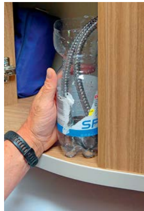
- Met wat knutselwerk werd een defecte slang gerepareerd.