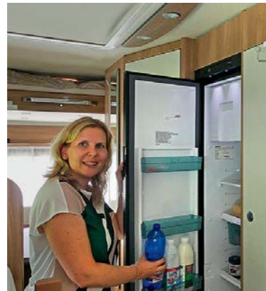
+ De koelkast heeft een inhoud van 142 liter.