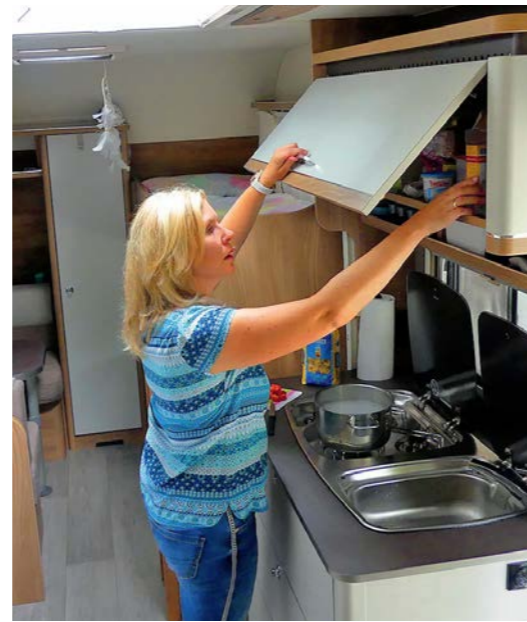
+ Het keukenblok biedt voldoende opbergruimte onder de speelbak en in de bovenkast; de koelkast staat ertegenover.