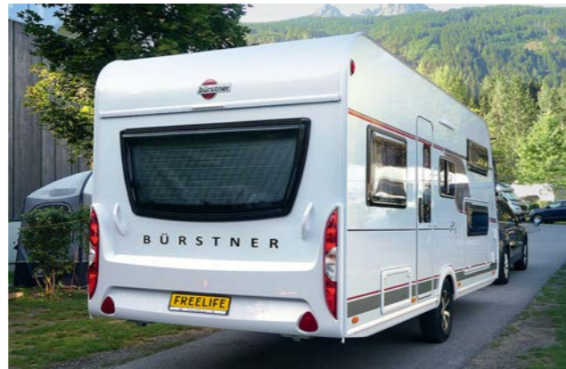
+ De Bürstner met glatte beplating vormt een fraaie combinatie met de Volkswagen Tiguan en gedraagt zich ondanks zijn hoogte keurig achter de trekauto.