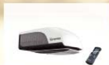
Truma Aventa compact met 1700 W Truma Aventa compact plus met 2200 W