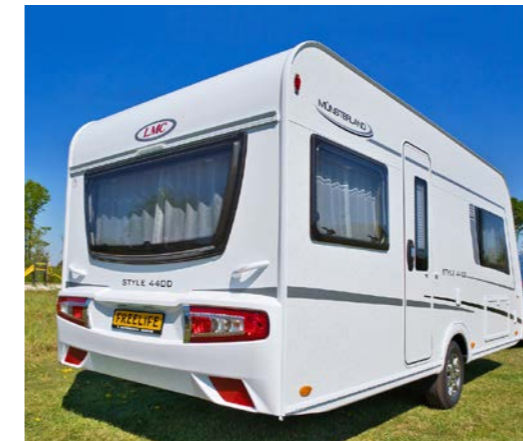
De LMC heeft hamerslag zijwanden. De gladde beplating van dak, voor- en achterkant is hagebestendig. De aluminium wielen zijn standaard.

De banken staan een stukje van de wand af. Daarmee wordt de ventilatie bevorderd en condensvorming beperkt. Van de tafel zijn we direct erg gecharmeerd. Deze zit namelijk niet vast aan de grond bevestigd en is zelfs uitneembaar. Superhandig, maar wel even vastzetten tijdens het rijden. Bovendien geniet je vanwege zijn compacte formaat van veel bewegingsvrijheid bij het zitten. Eten met vier man aan tafel is daarentegen wel weer krap. Door de tafel in te klappen creëer je op de banken twee extra slaapplekken. De zithoek heeft ramen rondom waardoor er lekker veel daglicht naar binnen kan vallen. Via het grote dakvenster komt er ook daglicht van boven. Wil je niet 'te kijk' zitten voor de burens, dan kun je vitrage voor de ramen trekken. Tevens heb je de optie een doorschijnend rolgordijn omlaag te trekken. Boven de zithoek zijn spotjes aangebracht die je dankzij een spanningsrail op iedere gewenste plaats kunt bevestigen.