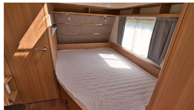
Dankzij het extra lange bed (2.10 m) hoef je niet snel bang te zijn dat je voeten buiten boord steken.