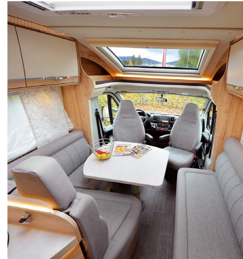
De grote zitgroep en de keuken zien er aantrekkelijk uit.

De wanden, het dak en de bodem van de opbouw vervaardigt Eura Mobil van houtvrije,