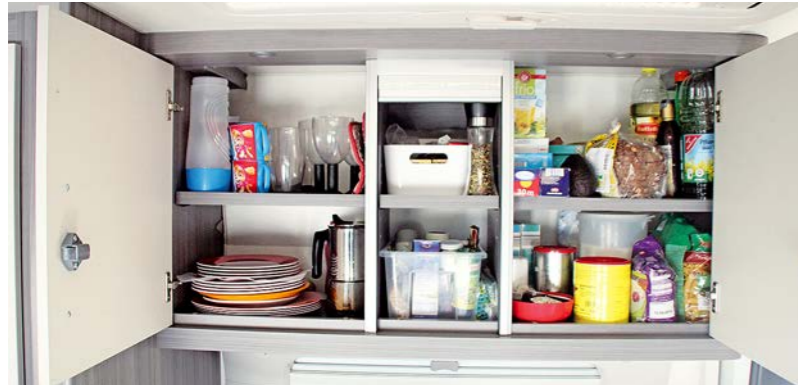
+ De bovenkast is voorbeeldig onderverdeeld. Hoge spullen moeten evenwel in de onderkast.