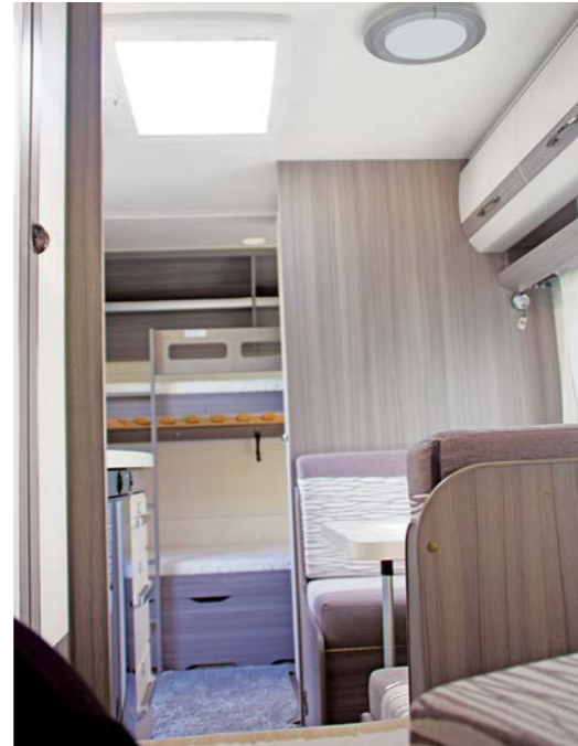
+ De Ontour 470 KMF is modern vormgegeven en brengt alle belangrijke leefelementen onder op een oppervlakte van tien vierkante meter.