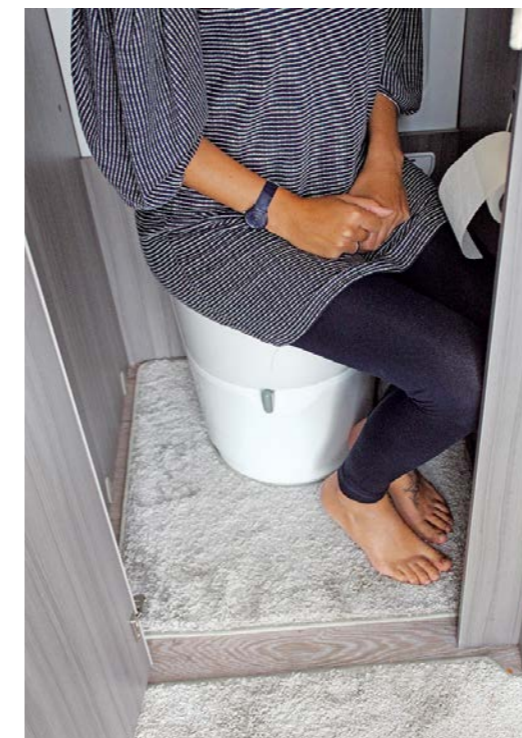
- De compacte toiletruimte is krap en niet hoogwaardig uitgevoerd. De wasbak hangt niet al te stevig vast en de beenruimte is beperkt.