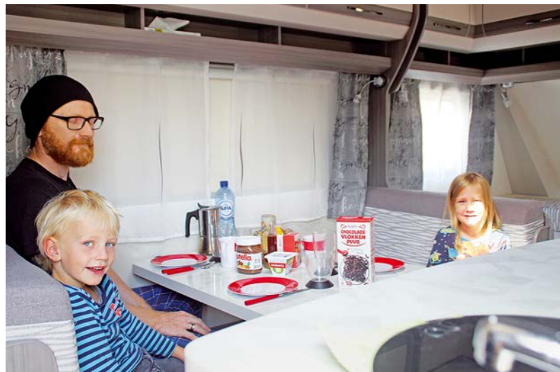
+ De zitgroep in het midden is net groot genoeg voor vier personen. De wielkasten belemmeren de beenruimte een beetje.