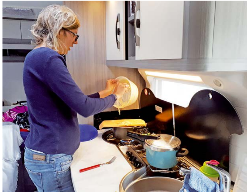
+ De keuken heeft ondanks de compacte afmetingen een mooi werkblad, perfect geschikt om een gezinsmaaltijd te bereiden.