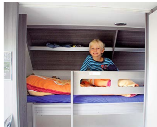
+ Het bovenste stapelbed is geschikt voor kinderen tot een bepaalde lengte. Het matras en de open legplanken zijn prima, de ladder is stevig. Het onderste bed is 201 x 75 centimeter, groot genoeg voor volwassenen dus zelfs.