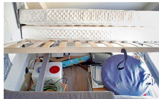
+ - Onder het ouderbed bevindt zich een riante bergruimte, die van bovenaf echter slecht toegankelijk is. Het usb-stopcontact is top.