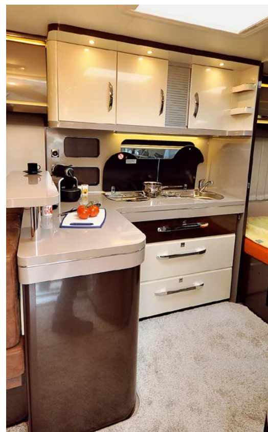
De L-keuken van de 560 CFe is een echte blikvanger en uiterst chic met een brede kookplaat en een groot aanrecht. Beter kan bijna niet.