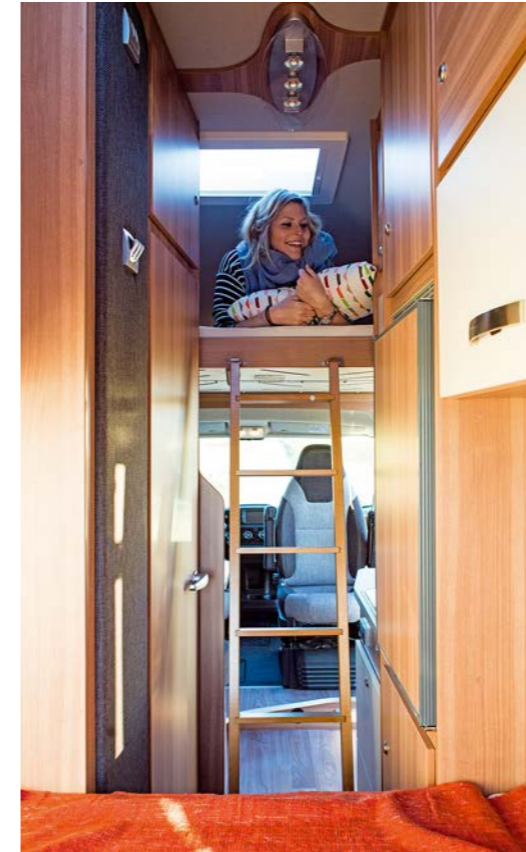
Zelfs met neergelaten hefbed heb je een ruimtelijk gevoel in de Carabus.

Het heeft minder met slapen dan met functionaliteit te maken, maar de lattenbodem van het achterste bed in de 601 MQH is zeer slim gemaakt. Sta je naast de koelkast voor het bed, dan is een deel eenvoudig omhoog te klappen. Zo kun je dus makkelijk bij de bagage onder het bed. Dat is praktischer dan het normaal gesproken zijwaarts opklappen van het gehele middendeel van de lattenbodem. Het bankje van de zitgroep bevalt ons goed, want het kan naar de zijkant worden uitgebreid. Geen ongewenst schouder- of heupcontact dus met de persoon die naast je zit. Zijn de stoelen van de bestuurder en de voorpassagier omgedraaid? Dan wordt het eten met vier mensen aan de tafel wat lastig voor de voorste passagier en degene die er tegenover zit, want de tafel is niet te vergroten. Van een op tafel geplaatst bord eten is haast onmogelijk.