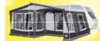
Royal 350 De Luxe