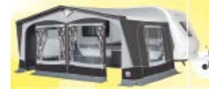
President XL280 De Luxe