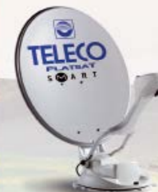
Satellietantennes en TV's

Kwaliteit en comfort die uw prachtige reizen een extra beleving geven.