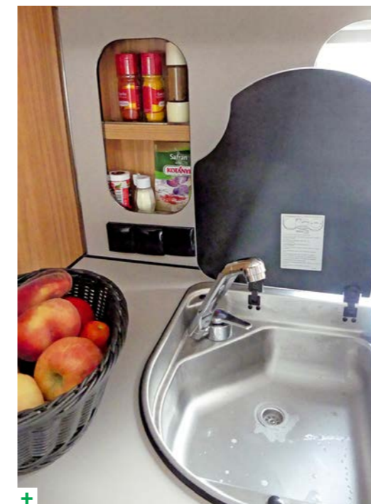
+ De onderhoudsvriendelijke achterwand bij het keukenblok wordt heel handig gebruikt als kruidenrek.