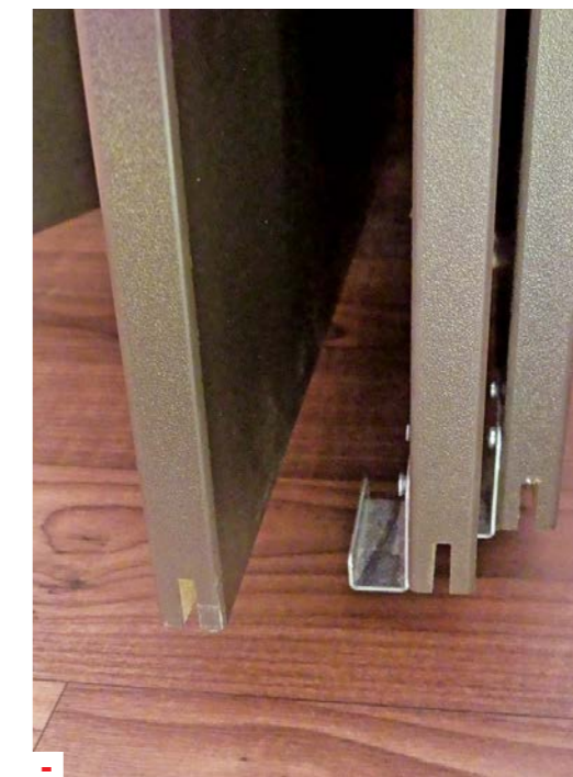
- De driedelige schuifdeur die de kinderkamer afsluit van het leefgedeelte komt al snel los.

De Eriba Exciting 505 is een klassieke gezinscaravan en houdt rekening met ieders wensen: grote, stevige stapelbedden, een goed uitgerust keukenblok met hooggeplaatste koelkast en een dinette in het midden waaraan het hele gezin comfortabel zit.