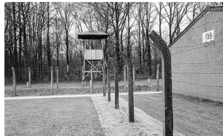
Nationaal Monument Kamp Vught/Jan van de Ven

Deze camping accepteert CampingCard ACSI, dé kortingskaart voor het laagseizoen