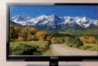
Televisies geschikt voor Canal digitaal en Joyné